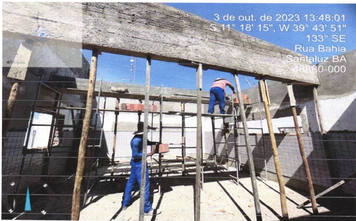
FOTO 08 - ALVENARIA DE VEDAÇÃO DE BLOCOS CERÂMICOS FURADOS NA HORIZONTAL DE 9X19X19CM (ESPESSURA 9CM) DE PAREDES COM ÁREA LÍQUIDA MAIOR OU IGUAL A 6M 2 SEM VÃOS E ARGAMASSA DE ASSENTAMENTO COM PREPARO EM BETONEIRA. AF_06/2014

FOTO 07 - ALVENARIA DE VEDAÇÃO DE BLOCOS CERÂMICOS FURADOS NA HORIZONTAL DE 9X19X19CM (ESPESSURA 9CM) DE PAREDES COM ÁREA LÍQUIDA MAIOR OU IGUAL A 6M 2 SEM VÃOS E ARGAMASSA DE ASSENTAMENTO COM PREPARO EM BETONEIRA. AF_06/2014