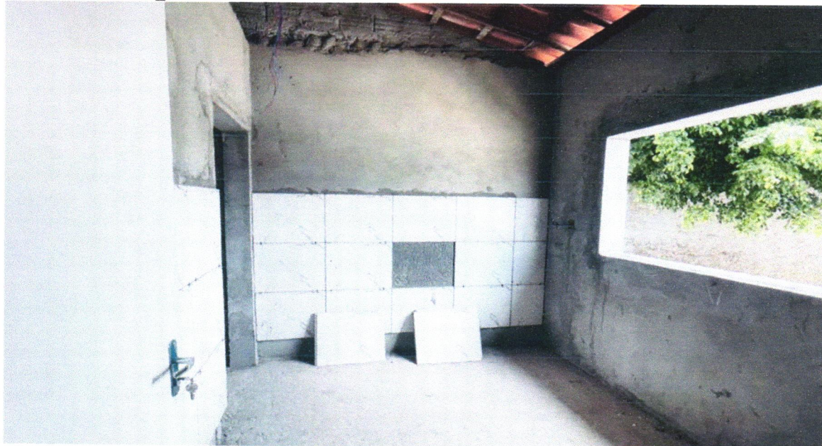
FOTO 20 - REVESTIMENTO CERÂMICO PARA PAREDES INTERNAS COM PLACAS TIPO ESMALTADA EXTRA DE DIMENSÕES 33X45 CM APLICADAS EM AMBIENTES DE ÁREA MAIOR QUE 5 M 2 NA ALTURA INTEIRA DAS PAREDES. AF_06/2014