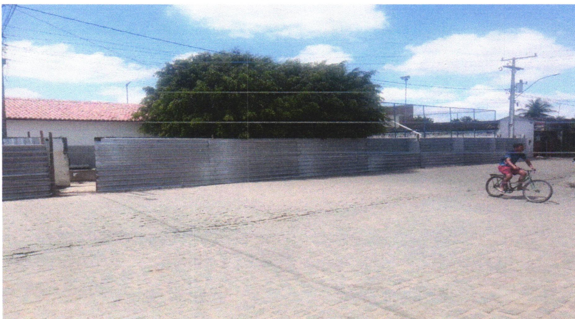
FOTO 02 - TAPUME COM TELHA METÁLICA. AF_05/2018