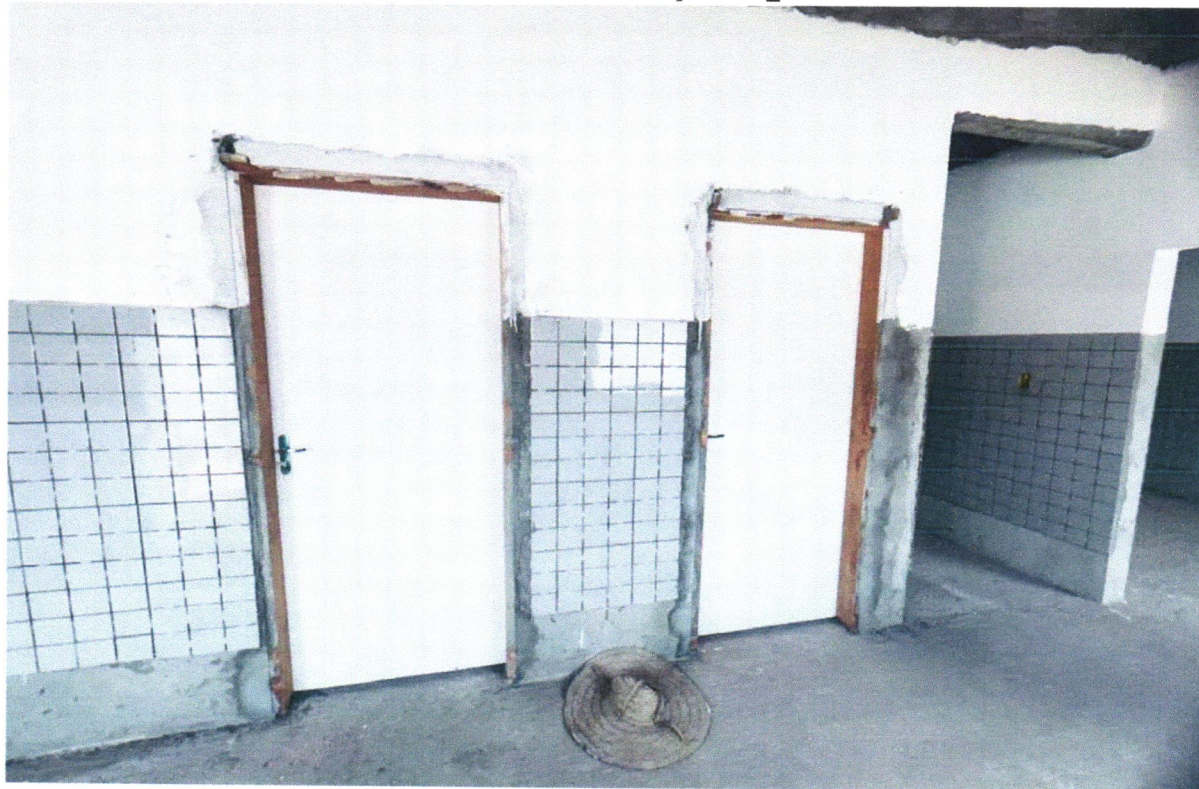
FOTO 14 - KIT DE PORTA DE MADEIRA PARA PINTURA, SEMI-OCA (LEVE OU MÉDIA), PADRÃO MÉDIO, 60X210CM, ESPESSURA DE 3,5CM, ITENS INCLUSOS: DOBRADIÇAS, MONTAGEM E INSTALAÇÃO DO BATENTE, SEM FECHADURA - FORNECIMENTO E INSTALAÇÃO. AF_12/2019

FOTO 13 - KIT DE PORTA DE MADEIRA PARA PINTURA, SEMI-OCA (LEVE OU MÉDIA), PADRÃO MÉDIO, 80X210CM, ESPESSURA DE 3,5CM, ITENS INCLUSOS: DOBRADIÇAS, MONTAGEM E INSTALAÇÃO DO BATENTE, SEM FECHADURA - FORNECIMENTO E INSTALAÇÃO. AF_12/2019