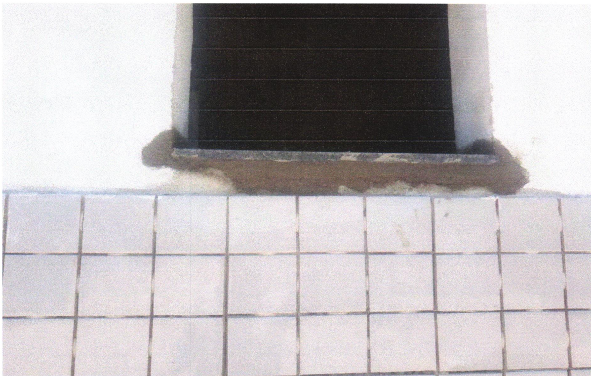
FOTO 10 - PEITORIL LINEAR EM GRANITO OU MÁRMORE, L = 15CM, COMPRIMENTO DE ATÉ 2M, ASSENTADO COM ARGAMASSA 1:6 COM ADITIVO. AF_11/2020

FOTO 09 - PEITORIL LINEAR EM GRANITO OU MÁRMORE, L = 15CM, COMPRIMENTO DE ATÉ 2M, ASSENTADO COM ARGAMASSA 1:6 COM ADITIVO. AF_11/2020