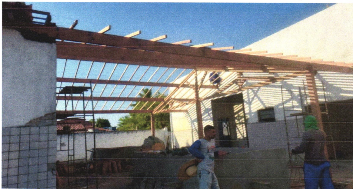
FOTO 24 - TRAMA DE MADEIRA COMPOSTA POR RIPAS, CAIBROS E TERÇAS PARA TELHADOS DE ATÉ 2 ÁGUAS PARA TELHA CERÂMICA CAPA-CANAL, INCLUSO TRANSPORTE VERTICAL. AF_07/2019