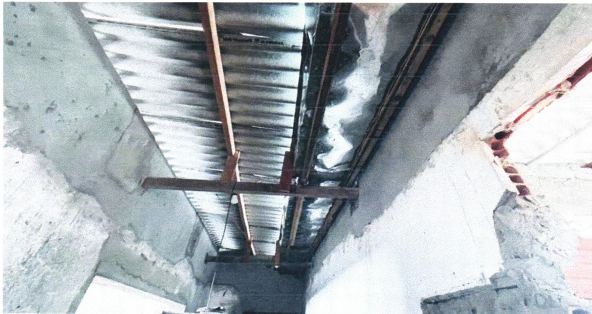
FOTO 26 - CALHA EM CHAPA DE AÇO GALVANIZADO NÚMERO 24, DESENVOLVIMENTO DE 50 CM, INCLUSO TRANSPORTE VERTICAL. AF_07/2019