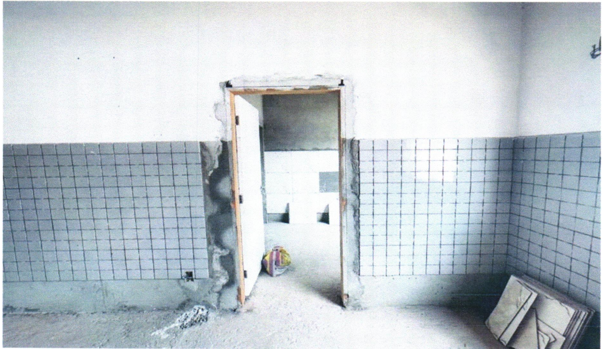
FOTO 12 - KIT DE PORTA DE MADEIRA PARA PINTURA, SEMI-OCA (LEVE OU MÉDIA), PADRÃO MÉDIO, 90X210CM, ESPESSURA DE 3,5CM, ITENS INCLUSOS: DOBRADIÇAS, MONTAGEM E INSTALAÇÃO DO BATENTE, SEM FECHADURA - FORNECIMENTO E INSTALAÇÃO. AF_12/2019

FOTO 11 – KIT DE PORTA DE MADEIRA PARA PINTURA, SEMI-OCA (LEVE OU MÉDIA), PADRÃO MÉDIO, 90X210CM, ESPESSURA DE 3,5CM, ITENS INCLUSOS: DOBRADIÇAS, MONTAGEM E INSTALAÇÃO DO BATENTE, SEM FECHADURA - FORNECIMENTO E INSTALAÇÃO. AF_12/2019