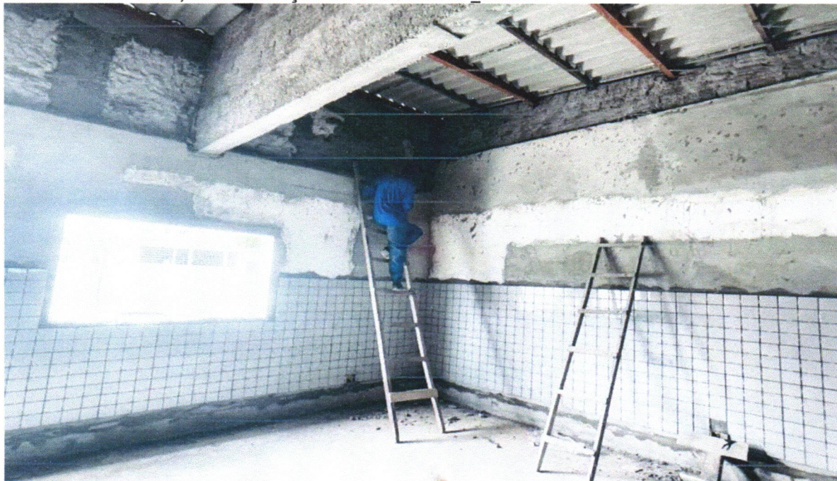
FOTO 06 - MASSA ÚNICA, PARA RECEBIMENTO DE PINTURA, EM ARGAMASSA TRAÇO 1:2:8, PREPARO MECÂNICO COM BETONEIRA 400L, APLICADA MANUALMENTE EM FACES INTERNAS DE PAREDES, ESPESSURA DE 10MM, COM EXECUÇÃO DE TALISCAS. AF_06/2014

FOTO 05 - MASSA ÚNICA, PARA RECEBIMENTO DE PINTURA, EM ARGAMASSA TRAÇO 1:2:8, PREPARO MECÂNICO COM BETONEIRA 400L, APLICADA MANUALMENTE EM FACES INTERNAS DE PAREDES, ESPESSURA DE 10MM, COM EXECUÇÃO DE TALISCAS. AF_06/2014