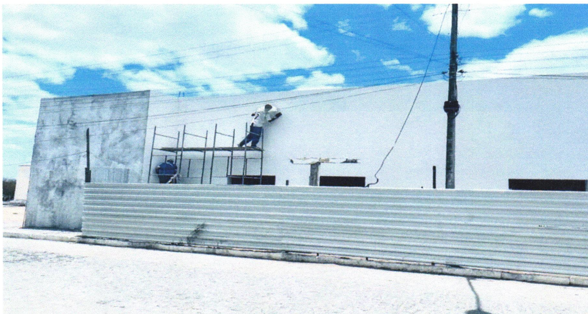
FOTO 32 - APLICAÇÃO E LIXAMENTO DE MASSA LÁTEX EM PAREDES, UMA DEMÃO. AF_06/2014