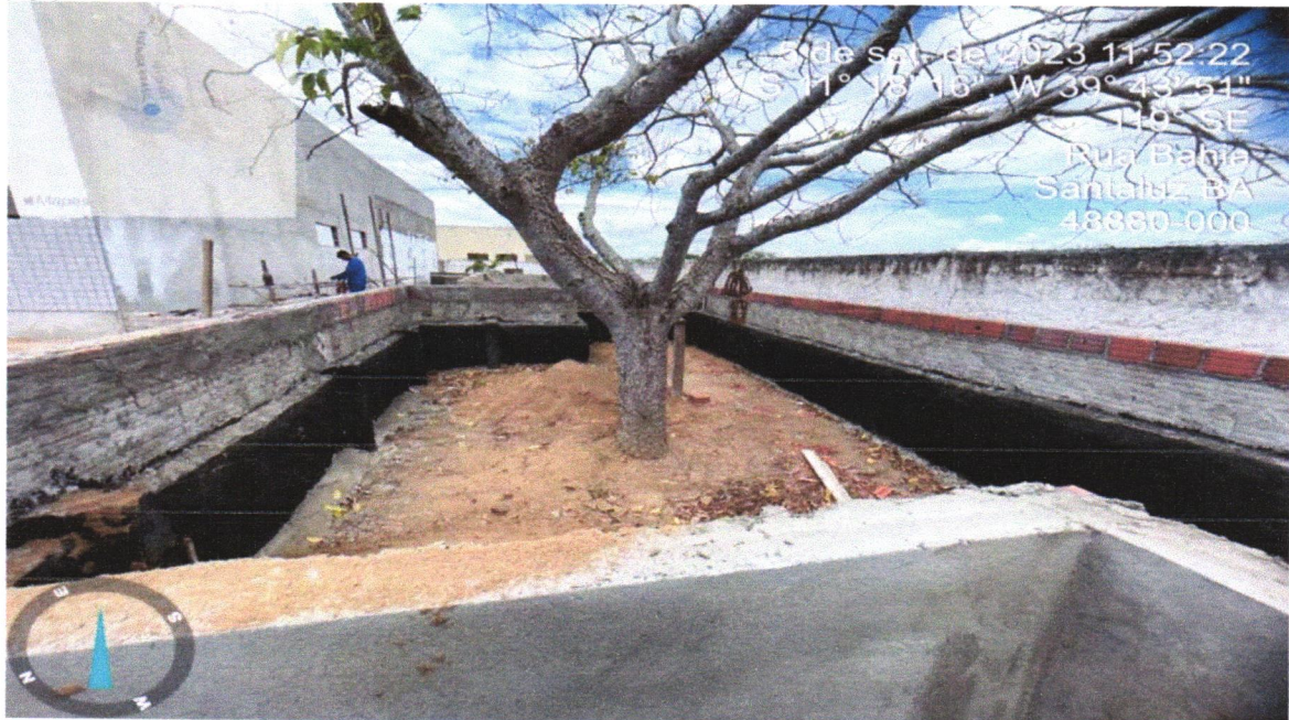
FOTO 18 - MASSA ÚNICA, PARA RECEBIMENTO DE PINTURA, EM ARGAMASSA TRAÇO 1:2:8, PREPARO MECÂNICO COM BETONEIRA 400L, APLICADA MANUALMENTE EM FACES INTERNAS DE PAREDES, ESPESSURA DE 10MM, COM EXECUÇÃO DE TALISCAS. AF_06/2014